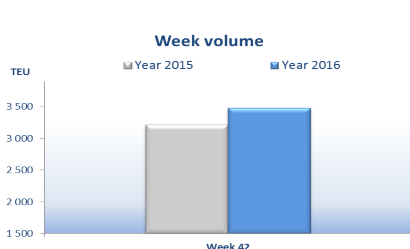
Moves in/out Week 42