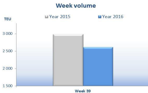
Moves in/out Week 39