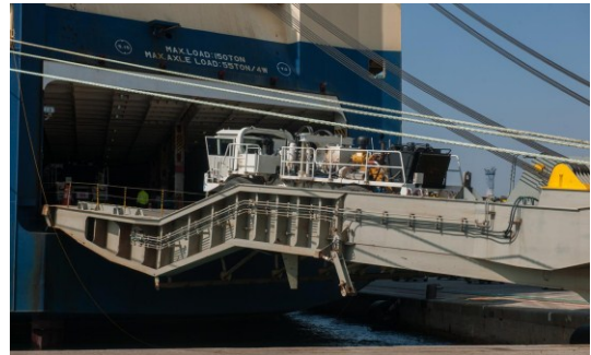
M/S Morning Carol - EUKOR MNT Line